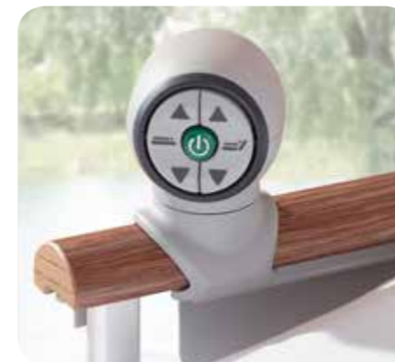
Controller zonder kabel of batterij