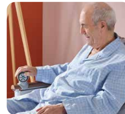
Individueel aan te passen op iedere bewoner