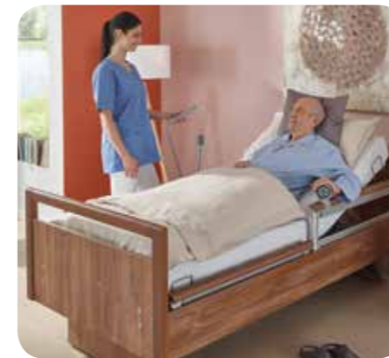
Eenvoudige bedbediening voor de bewoner

SafeLift kan heel eenvoudig worden bediend, zodat de bewoner zijn bed zelfstandig van positie kan veranderen en in de voor hem optimale mobilisatiepositie kan brengen. Bovendien kan hij bij het opstaan op de SafeLift-greep leunen. Hierdoor wordt de zelfmobilisatie van de bewoner bevorderd, hoeft het personeel minder vaak te worden opgeroepen om het bed te verstellen en wordt het verplegend personeel ontlast.